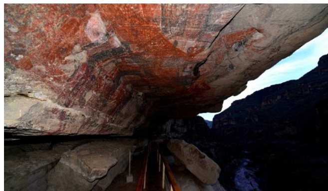
Cueva La Pintada, Sierra de San Francisco, B. C. S.

El Jesuita Miguel del Barco refiere que rogó al misionero de San Ignacio, Padre Joseph Rothea, que escribiera sobre los restos que encontró y este es el testimonio del misionero: "Los fundamentos que, probablemente persuaden de que hubo gigantes en la California se reducen a tres: primero, el Padre Joseph, dice que buscó donde le indicaron que había un esqueleto de gigante: "Comencé a cavar y de hecho di con un pedazo de cráneo bien grande, el que, por más cuidado que puse, se desmoronó al sacarlo. Poco más adelante descubrí los huesos o vértebras del espinazo... los cuales llevé a la misión y cotejados con los de nuestros muertos, vi que los del gigante eran como tres tantos mayores...", segundo, las cuevas pintadas y tercero, según los ancianos, en tiempos más antiguos "había venido una porción de hombres y mujeres de extraordinaria altura, venían huyendo unos de otros. Parte de ellos tiró por lo largo de la costa del mar del Sur y la otra parte tiró por el áspero de la tierra. Según los ancianos, ellos eran los autores de dichas pinturas", dijo, refiriéndose a las pinturas rupestres.. Decían por último, Cuenta la leyenda que los gigantes murieron en batallas entre ellos, batallas entre californios, y algunos cayeron al mar y fueron devorados por las criaturas marinas que ahí habitaban..."