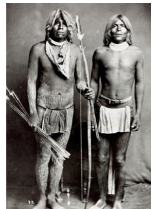
Hombres Cucapá con pintura en el cuerpo, hacia 1900

“Realizaban una ceremonia en donde subían al cerro, durante una semana. Se pintaban su cuerpo de negro que simbolizaba todo el mal que había en su cuerpo y alma y al transcurrir de los días se iban pintando rayas blancas, símbolo de limpieza del espíritu. A la semana bajaban al río y se lavaban quedando totalmente purificados. A esta ceremonia se le conoce como la Ceremonia del Borrado o pintado y se lleva a cabo en la semana Santa”.