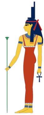
La diosa Nefhtis.

1. LA INMANIFESTADA KUNDALINI. La primera es NEPHTIS, primer aspecto, es nada menos que la inmanifestada Prakriti millones y billones de universos nacen y mueren entre el seno de la Prakriti. Todo cosmos nace de la Prakriti y se disuelve en la Prakriti, todo mundo es una bola de fuego que